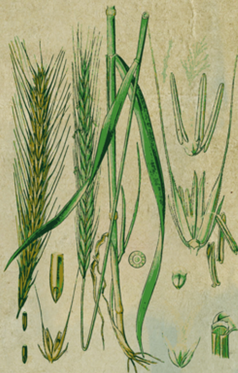
Żyto ( Secale L.)