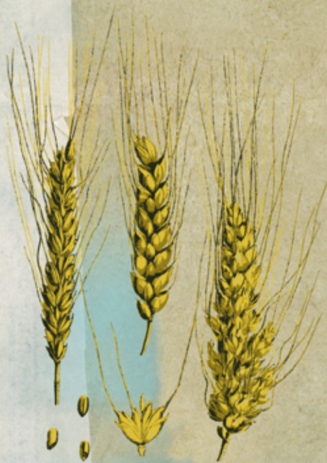
Pszenica ( Triticum L.)

Na obrazkach znajdują się pszenica i żyto – zboża, które w kręgu kultury europejskiej odgrywały i nadal odgrywają najważniejszą rolę. Przyjrzyj im się uważnie, a następnie własnymi słowami opisz budowę źdźbeł.